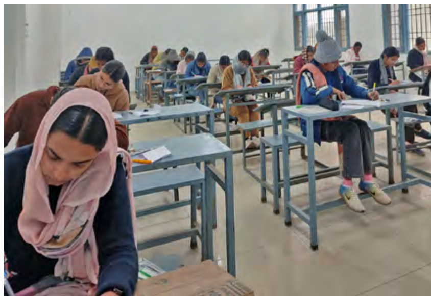
ਸਾਬਕਾ ਹਥਿਆਰਬੰਦ ਸੈਨਾ ਦਿਵਸ ਦੇ ਮੌਕੇ ਇੱਕ ਮੁਕਾਬਲੇ ਵਿੱਚ ਭਾਗ ਲੈਂਦੇ ਵਿਦਿਆਰਥੀ।