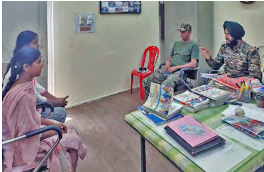
ਐੱਨ.ਸੀ.ਸੀ. ਦੇ ਪਹਿਲੇ ਬੈਚ ਲਈ ਕੈਡਿਟਾਂ ਦੀ ਚੋਣ।

ਮਨਾਇਆ ਗਿਆ। ਵਿਦਿਆਰਥੀਆਂ ਨੇ ਪੋਸਟਰ ਤਿਆਰ ਕਰਕੇ ਰਾਸ਼ਟਰੀ ਇਕਜੁੱਟਤਾ, ਸੁਰੱਖਿਆ, ਐੱਨ.ਸੀ.ਸੀ. ਦੀ ਮਹੱਤਤਾ ਅਤੇ ਚੰਗੇ ਨਾਗਰਿਕ ਦੇ ਗੁਣਾਂ ਬਾਰੇ ਸੁਨੇਹੇ ਦਿੱਤੇ। ਇਸਦੇ ਨਾਲ ਹੀ ਪੌਦੇ ਲਗਾ ਕੇ ਵਾਤਾਵਰਨ ਪ੍ਰਤੀ ਆਪਣੀ ਜ਼ਿੰਮੇਵਾਰੀ ਦਰਸਾਈ।