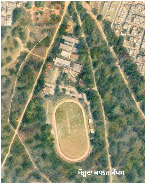
ਮੌਜੂਦਾ ਕਾਲਜ ਕੈਂਪਸ